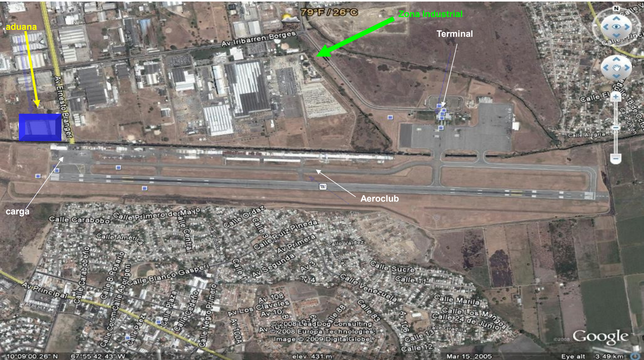
Aeropuerto Internacional Arturo Michelena, Carabobo